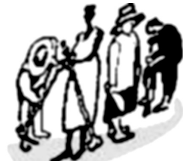
La Via Campesina

En últimes dècades hem vist avançar el capital financer i les empreses transnacionals sobre tots els aspectes de l' agricultura i del sistema alimentari dels països i del món. Des de la privatització de les llavors i la venda d' agro-tòxics, fins a la compra de la collita, el procesament dels aliments, i el seu transport, la distribució i venda al consumidor, tot és ja en mans d' un nombre reduït d' empreses. Els aliments han passat de ser un dret de tots i totes, a ser una mercaderia més. S' estan homogeneïtzant les dietes a tot el món,