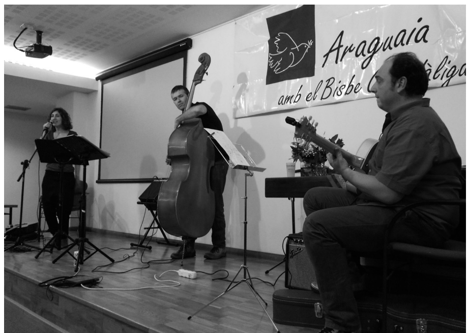
Actuació musical del grup TripleClic